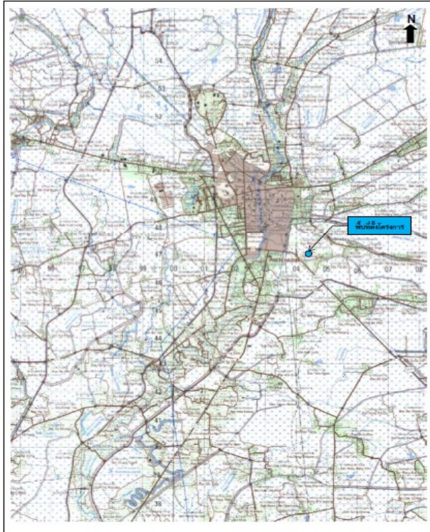
รูปที่ 1-1 ที่ตั้งโครงการ