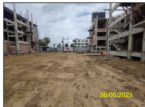
ภาพที่ 1-1 สภาพปัจจุบันของโครงการ